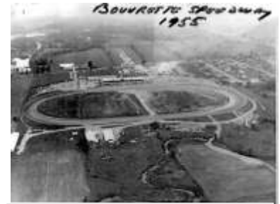
En haut: La piste Bouvrette de St-Jérôme en 1955